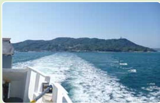
▲フェリーから望む能古島 (中央最高地点が頂上)

手前からは海岸線沿いの平坦道になる。やがて分岐⑦から45分程で渡船場に降り着く。分岐⑦からは、西鉄バスを利用して戻ることもできる。 範囲 福岡市西区能古島 歩行距離 6・2 km 歩行時間 110分 一口メモ このしまアイランドパークではコスモスなど、四季折々の花を観賞できる。