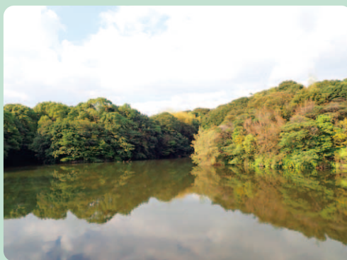
ぜんぞう池(浦山公園)

千葉県 ちば の成田山 なりだ の分霊 ぶんれい を祭っている成田山久留米分院。高さ62mの大観音像(救世慈母大観音像)がひと際目立つ。そのすぐそばの小高い森が浦山公園だ。自然とふれあえるルートを周回する。 JR久留米駅か西鉄久留米バスセンターから西鉄バスに乗車し二軒茶屋 にけんぢや で下車。公園入口の分岐①まではすぐ。マイカーのときはこの駐車場にとめる。