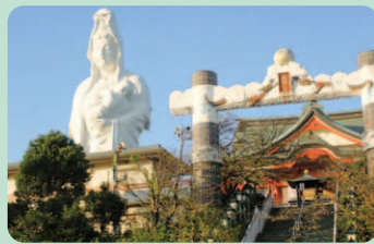
成田山の救世慈母大観音像

場所 久留米市 一口メモ 大観音像の胎内の中をのぼり眺望窓から雲仙など遠方の景色が見晴らせる。