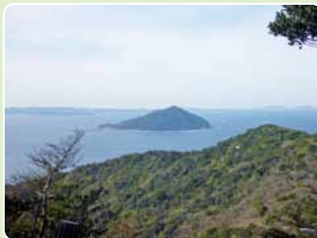
▲姫島最高峰の鎮山の全形(立石山より)

ある。頂上から40分程で野村望東尼御堂に着く。尼像、遺品なども展示されている。ここから渡船場まではおよそ10分で帰り着く。 範 囲 糸島市姫島 歩行距離 3・2km 歩行時間 95分 一コマ 岐志港には、10月から翌年3月頃にかけてカキ小屋が並び、