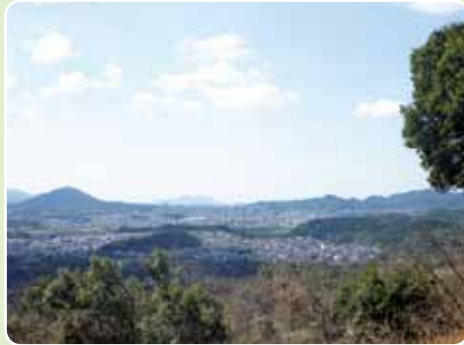
▲宗像市街と許斐山、奥に立花山(望みの丘頂上より)