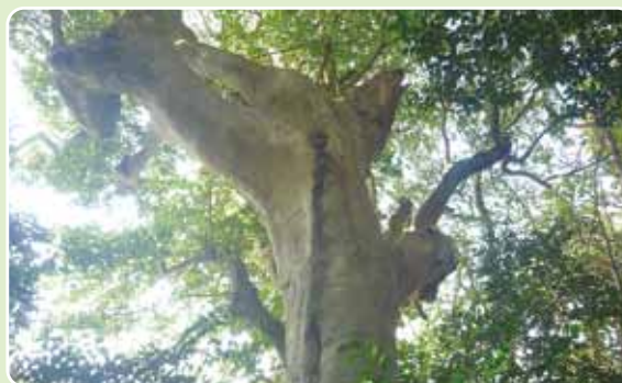
▲クロガネモチの巨木 (皇石神社)

識がある分岐⑤が現れる。右折して住宅街の中を歩いて行くと、25分位でししぶ駅に辿り着く。 範囲 古賀市鹿部山公園 歩行距離 2・9 km 歩行時間 50分 一〇×モ 鹿部山公園内には散策路も整備され、サクラ、カエデ、ウメなども植栽されている。