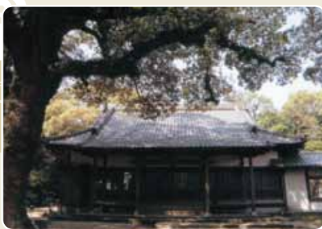
▲本堂の大屋根まで枝を伸ばす大楠

立派な墓碑が建つ。国重文の寺宝「絹本着色大応国師像」は毎年開山忌だけ公開される。 南浦紹明（1235〜1308） は駿河の人、博多承天寺の開山聖一國師の血縁の甥とか。十五歳で建長寺の大覚禪師（蘭深道隆）に学ぶ。入宋し虚堂智愚の元で九年間修行、嗣法して帰国。興徳寺から転じた太宰府の崇福寺で三十三年間住持を務めて多くの弟子を育て、臨済宗の香梁をなす法脈「応灯関」の基礎を創る。鎌倉建長寺で延慶元年に遷化、七十四歳。宇多法皇から日本人初の国師号「円通大応国師」の諡号を賜る。